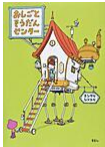
「おしごとそうだんセンター」 ヨシタケ シンスケ／著 集英社