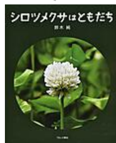
「シロツメクサはともだち」 鈴木 純／著 ブロンズ新社