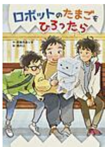
「ロボットのおたまごをひろったら」 奈雅月 ありす／作 ポプラ社