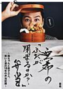
「亜希の『ふたが閉まるのか?』弁当」 亜希／著 オレンジページ