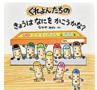
「くれよんたちのきょうは なにかこうかな?」 なかや みわ／作 Gakken