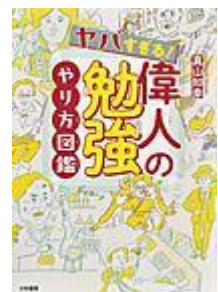
「ヤバすぎる! 偉人の勉強 やり方図鑑」 真山 知幸／著 大和書房