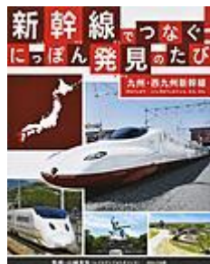
「新幹線でつなぐ! にっぽん発見のたび」 山崎 友也／著 ほるぷ出版