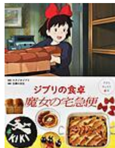
「ジブリの食卓 魔女の宅急便」 スタジオジブリ／監修 主婦の友社