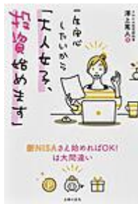
「一生安心したいから『大人女子、投資始めます』」 澤上 篤人／著 主婦の友社