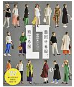
「着回せる服、育てる服」 SEEK BASIS／著 日本ヴォーグ社