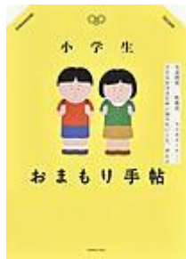
「小学生おまもり手帖」 オレンジページ