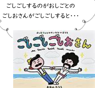
「ごしごしおさん」 おおの たろう／作 ポプラ社