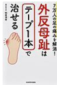
「外反母趾はテープ1本で治せる」 柏倉 清孝／著 KADOKAWA