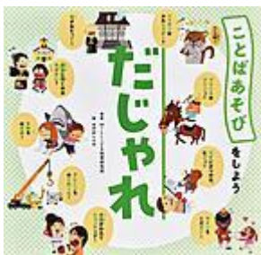
「だじゃれ」 WILL こども知育研究所／編・著 金の星社