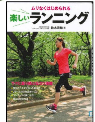
『ムリなくはじめられる 楽しいランニング』 鈴木 清和/著 成美堂出版