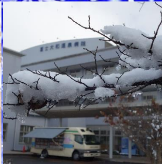
富士大和温泉病院

エントランスに飾られていたクリスマスツリーです。イルミネーションがキラキラしてとても素敵でした。