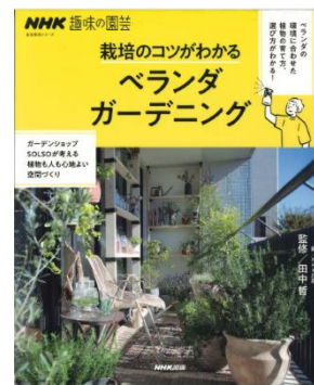
『栽培のコツがわかる ベランダガーデニング』 NHK出版/編 田中 哲/監修 NHK出版