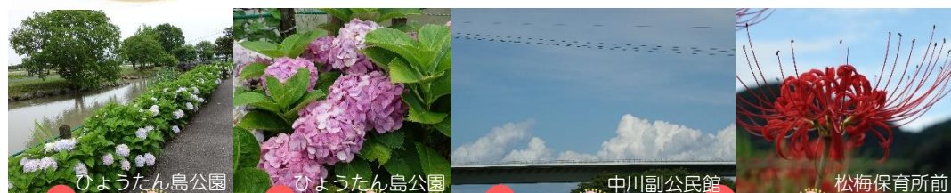
ひょうたん島公園

「ブーカスの車窓から」に載せようと、日頃よりご利用の様子や風景などをカメラに収めていますが、紙面の都合上載せきれなかったもの達が眠っています。その一部を紹介いたします！今回は6月から10月に撮ったものです。